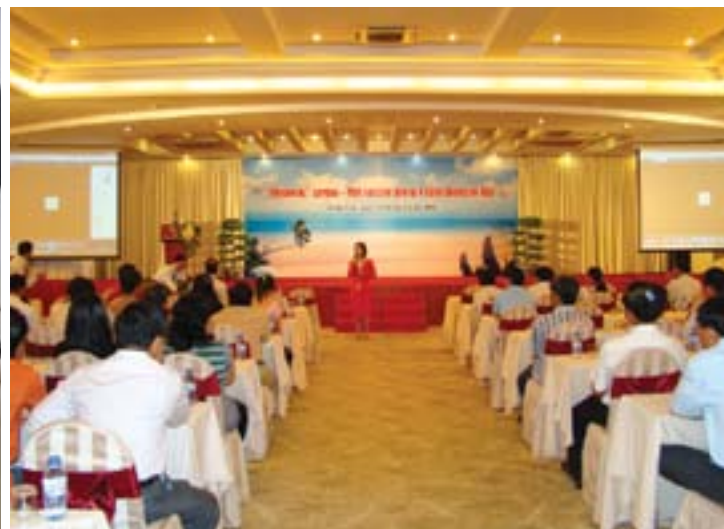
Hội thảo cung cấp các kiến thức cho nhà chăn nuôi về dịch bệnh và các giải pháp phòng trị

Trong thời điểm thị trường thuốc thú y cạnh tranh khá gay gắt như hiện nay, mỗi công ty luôn tìm cho mình một hướng đi và phương châm phát triển. Với Hoàng Kim, tiêu chí để phát triển và bền vững dựa trên 2 yếu tố "Sản phẩm tốt nhất, Dịch vụ tốt nhất". Trải qua 10 năm gắn bó và đồng hành cùng nhà chăn nuôi, Công Ty Thuốc Thú Y Hoàng Kim đã không ngừng phấn đấu để xây dựng cho mình một thương hiệu "Hoàng Kim" uy tín, chất lượng với hơn 70 chủng loại sản phẩm thuốc thú y và thủy sản. Chủng loại sản phẩm đa dạng, từ vaccine, thuốc kháng sinh phòng và trị bệnh, đến các loại thuốc bổ, premix, dinh dưỡng bổ sung vào thức ăn đến các loại thuốc trị ký sinh trùng, kháng viêm và thuốc sát trùng, tẩy rửa đường ống dẫn nước uống trong trang trại.