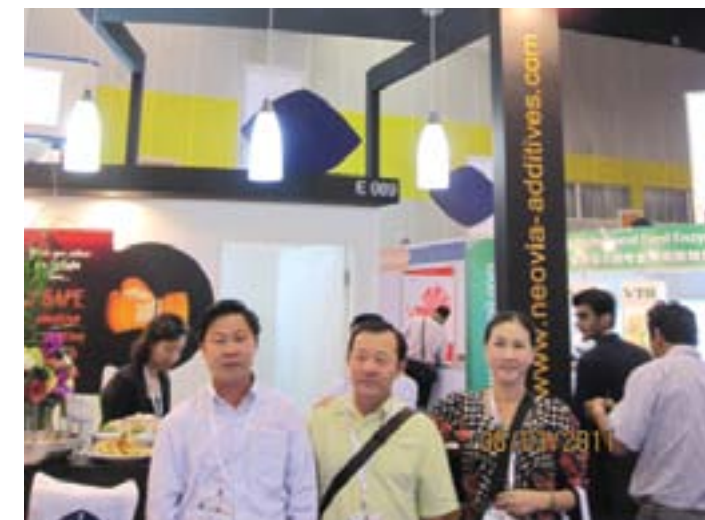
Khách hàng tham dự VIV Bangkok cùng Cty Hoàng Kim

là các bác sỹ thú y và kỹ sư chăn nuôi được đào tạo chính quy với nhiều năm kinh nghiệm. Ngoài việc tư vấn các tính năng kỹ thuật của sản phẩm, các qui trình chăn nuôi tiên tiến cho nhà chăn nuôi, đội ngũ kỹ thuật còn luôn sẵn sàng có mặt tại trại để hỗ trợ cho bà con khi có yêu cầu.