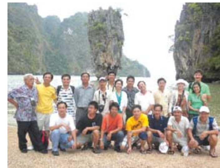
Cty Hoàng Kim và khách hàng tại Đảo James Bond 007

Yếu tố thứ hai cũng không kém phần quan trọng trong phương thức hoạt động của công ty là khâu hỗ trợ dịch vụ kỹ thuật cho người chăn nuôi. Công ty Hoàng Kim, với đội ngũ nhân viên kỹ thuật 100%