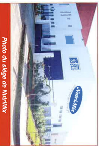
Photo du siège de NutriMix

En tant que firme-service, NutriMix soutient également ses clients à travers plusieurs interventions : la formulation alimentaire par optimisation, l'encadrement technique, le contrôle et le suivi des matières premières et des aliments fabriqués, l'orientation des clients vers les nouvelles techniques et innovations scientifiques, ... NutriMix a démarré ses activités il y a plus d'un an, avec pour objectif de se développer sur un marché très concurrentiel.